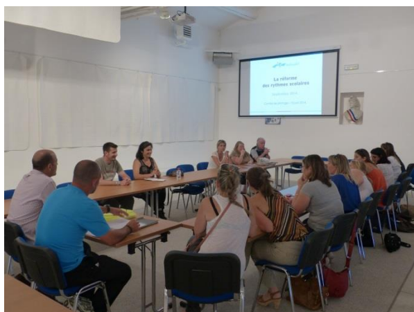
COPIL du 16 juin 2014 , Espace Vigneron

Malgré les contraintes générées par sa mise en œuvre (budget, ressources humaines...), c'est avant tout l'intérêt des enfants et des familles qui a guidé la démarche de la municipalité.