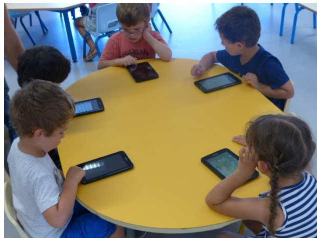
Les enfants s'initient à l'informatique grâce à des tablettes tactiles