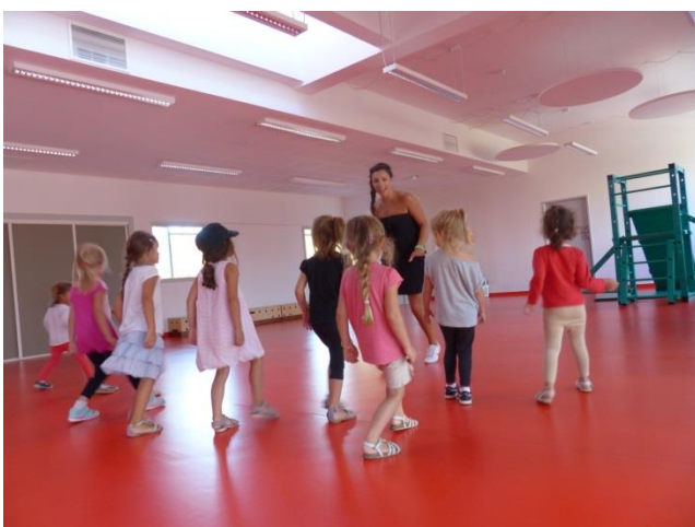
Beaucoup de filles présentes au « cours » de Babygym