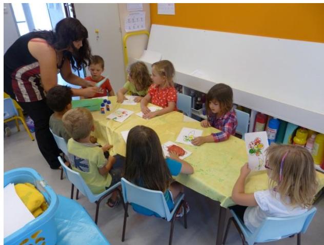
De jolies fleurs créées par les enfants