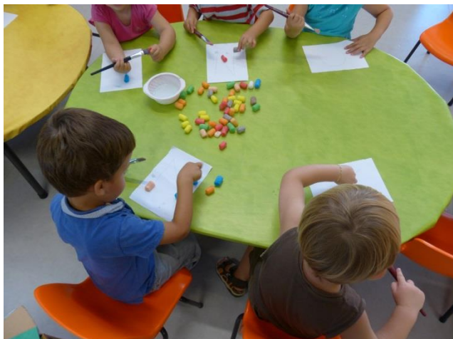
Atelier manuel multicolore