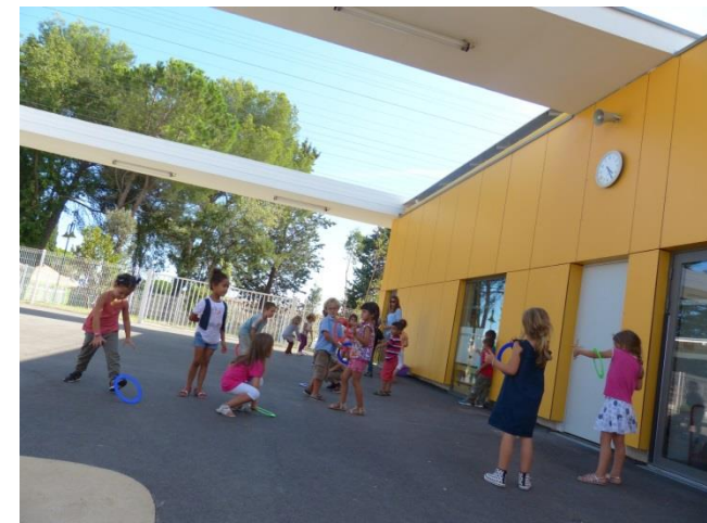
Les enfants s'initient à l'art du cirque