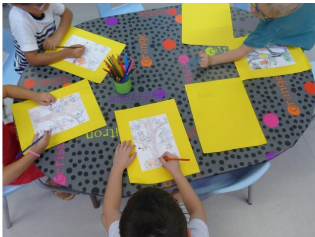
Atelier dessin pour les maternelles